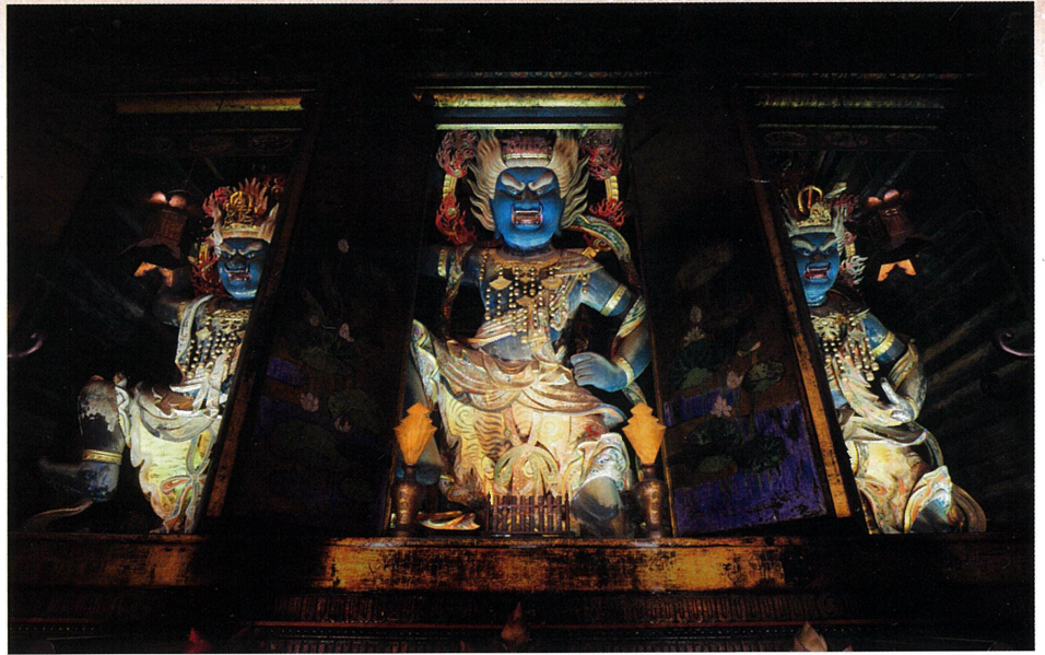
蔵王堂ご本尊、日本最大の秘仏 金剛蔵王大権現3体(重要文化財)